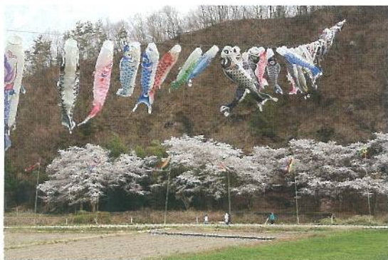
春の風物詩こいのぼりと桜