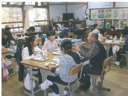
地域の皆さんと育てた野菜と一緒に食べる昼食会