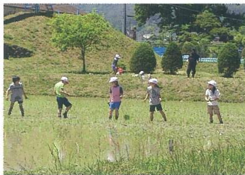
学校の敷地内でお米を作る

平成24年には「地域による学校支援活動」推進にかかる文部科学大臣賞を受けました。