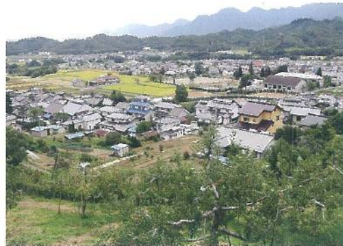
りんご畑から浦里地区を望む

地区内には、浦野、越戸（こうど）、藤之木、浦野南団地の4つの自治会（町内会）があり、それぞれの自治会では年間を通して様々な行事を行っています。