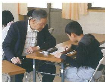
地域の皆さんが教えてくれる土曜塾