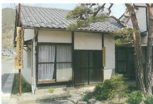
浦里希望の泉プロジェクト事務所

ゴミの出し方、地域つきあい、家庭菜園、子どもの学校のこと、美味しい店やおすすすめスポット… どんなことでもご相談ください。